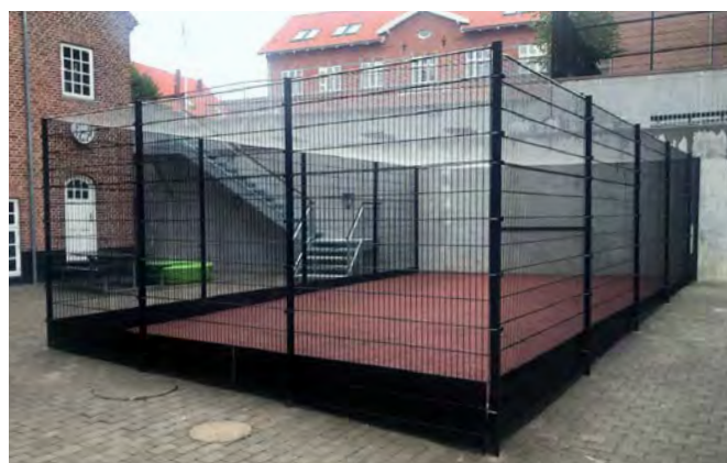
Boldbaner til skolegården med sort panelhegn