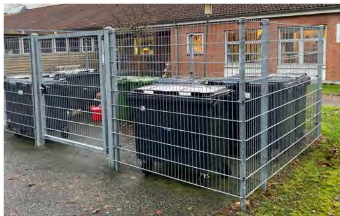
Sikring af affaldsgårde kan gøres med et sikkert panelhegn

Denne form for løsninger er også meget anvendelig til sikring af scooterområder eller cykelskure. Vi kan sammensætte af standardelementer eller bygge op efter specialmål. Vi sørger for nedtagning og bortskaffelse af tidligere hegn samt bortskaffelse af al opgravet jord.