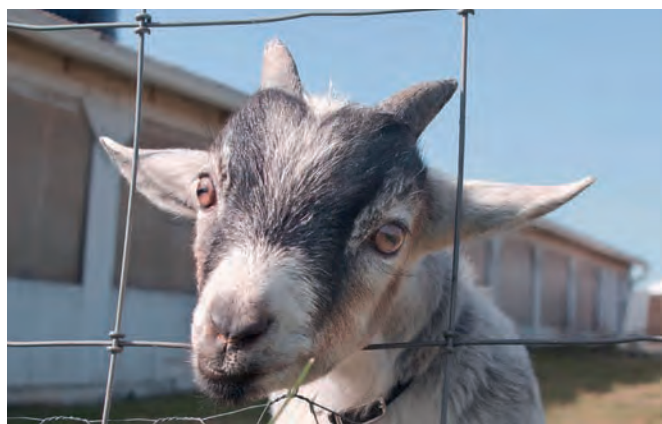
Sikker indhegning af dyr med nethegn eller trådhegn

Uanset om der vælges et trådhegn eller nethegn, opnås en sikker løsning med et godt hegn, der både er robust og synligt. Vi fører dertil også et stort udvalg af låger, der passer specielt til begge hegnstyper. Spørg os gerne til råds!