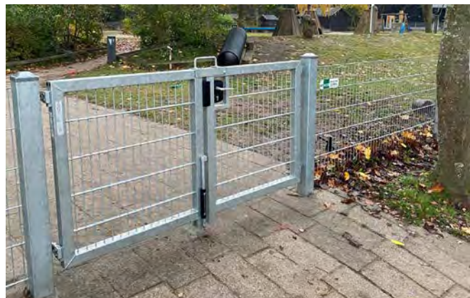
Panelhegn - ét hegn med mange anvendelsesmuligheder

Udover at vi anbefaler brug af en god, kraftig låge eller port, som sikrer indgangen, kan der tages højde for, hvem hegnet og lågen skal beskytte med ekstra sikringsmuligheder f.eks. højtstående lås, overfald, fjeder, indvendigt kuglegreb, 2 stk håndtag i forskellig højde eller 3-punkts håndtag. Tag os gerne med på råd!