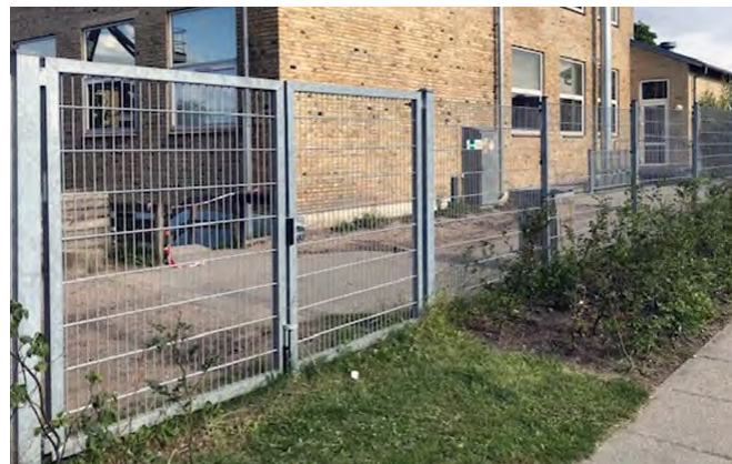
Panelhegn med tilhørende låger fås i mange højder

Boldbanehegn i mange forskellige mål og i op til 6 meters højde. I kan derfor få en skræddersyet løsning, der passer til jeres behov. Vi kan både tegne, designe samt levere og opsætte hegnet for jer. Vi rådgiver gerne helt fra opstartsfasen, så I kan være trygge ved, at vi kommer godt fra start. Brug os gerne til at "spille bold op af".