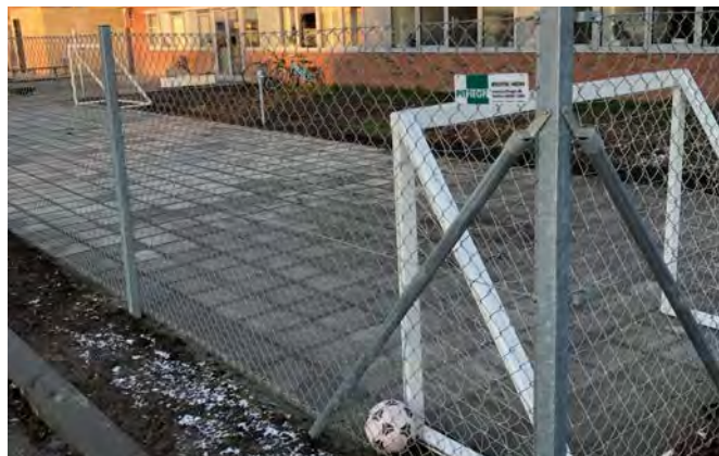
Fletvæv - en økonomisk vinder på den lange bane

Fletvæv kan med fordel sættes sammen med flere forskellige typer af låger bl.a. med panel - eller balusterudfyldning.