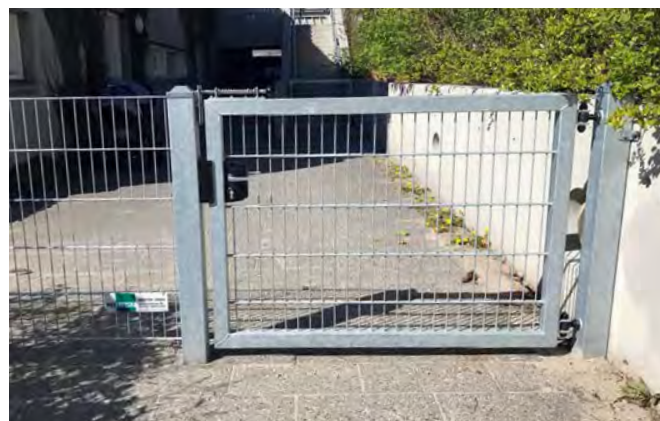
Børnehavelåger med ekstra børnesikring f.eks. fjederlås