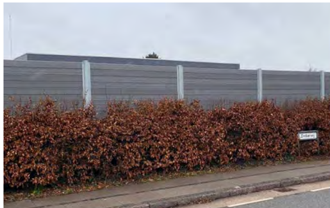
Komposithegn dæmper effektivt støj på begge sider

Hos PIT Hegn anvender vi ThomTek® Perilux komposithegn, som er et kvalitetshegn udviklet med en lyddæmpende struktur. Designet er moderne og stilrent og fås i 10 flotte farver.