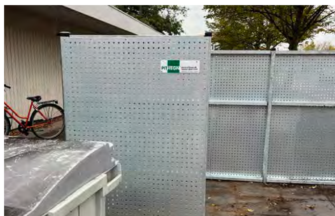
Sikring af affaldsgårde med pladehegn skærmer af