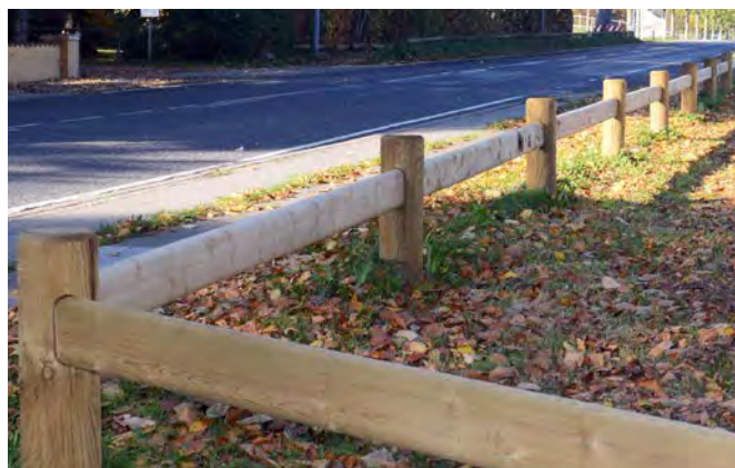
Tilpassede fodhegn med 20 års garanti mod råd

Selve fodhegnet består af stolper eller pæle samt en overligger af træ og der medfølger 20 års fuld garanti mod råd på alle stolper. Alle fodhegn fra PIT Hegn er unikt tilpassede.