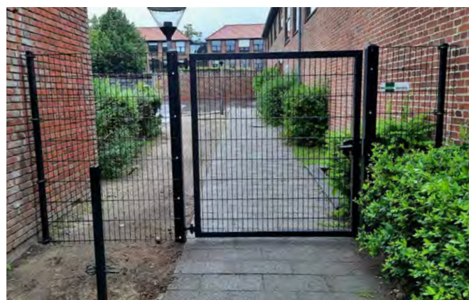
Panelhegn - den stærkeste sikringsløsning til institutioner