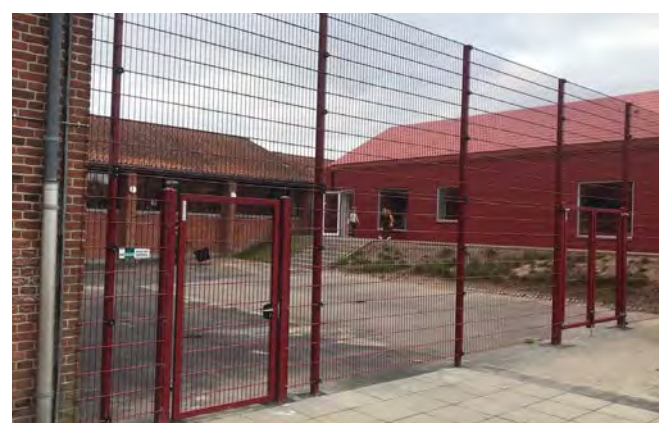
Panelhegn til boldbaner fås i mange farver og højder