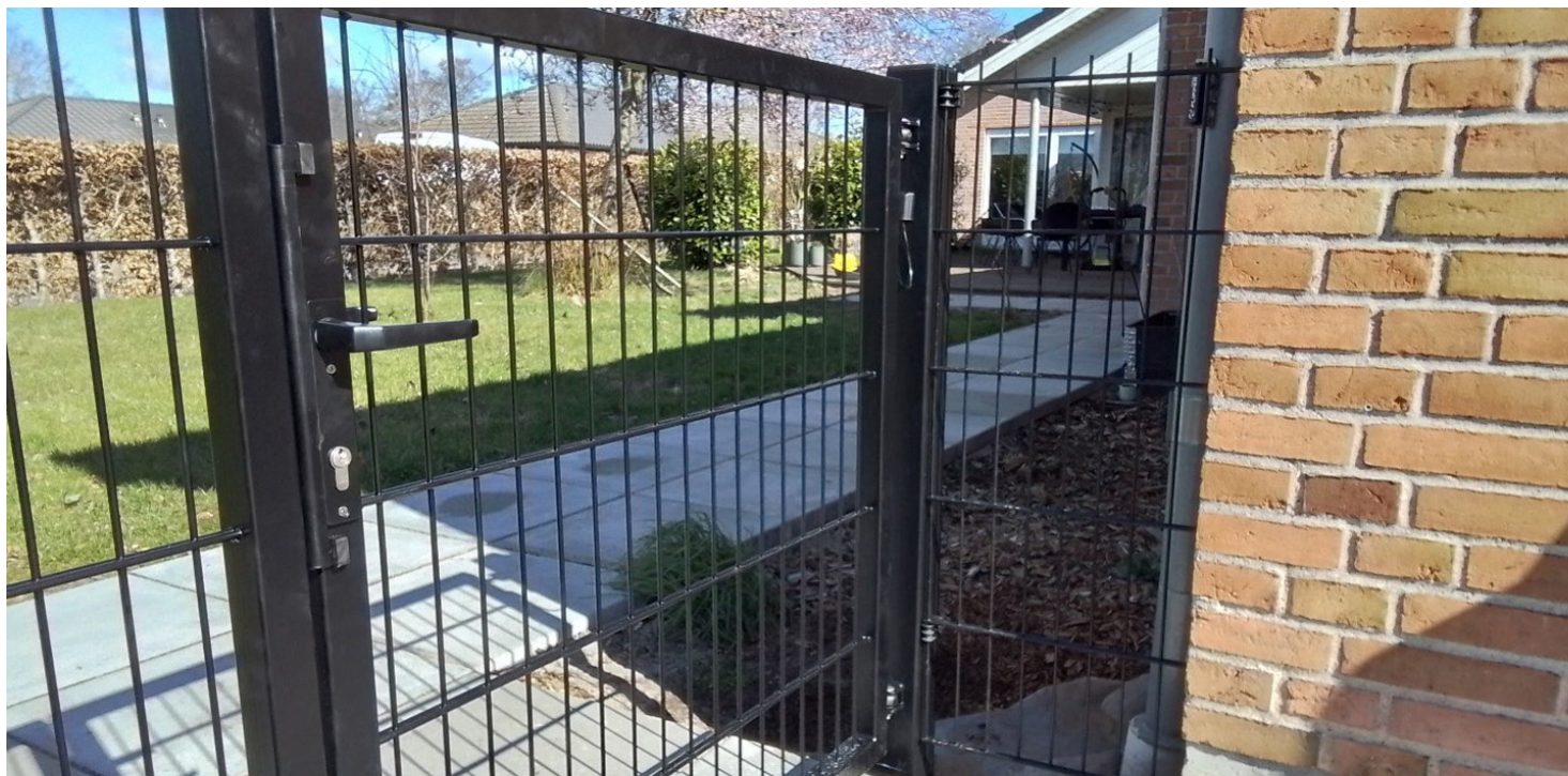
Gardia Light lågen er fleksibel i forhold til valg af åbningsretning