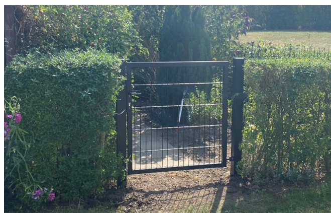
Gardia Light lågen fås i flere højder og bredder

Med sit enkle design, robuste stel og matchende udfyldning fremstår Gardia Light som en stilren løsning, der fuldender helhedsindtrykket af et moderne panelhegn – uanset om det monteres i en privat have eller ved et større anlæg.